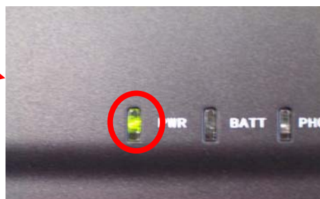
Figura 2 - Spia di accensione

L'alimentatore, l'interruttore e la spia devono essere come in figura.