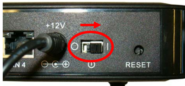
Figura 1 - Interruttore di accensione